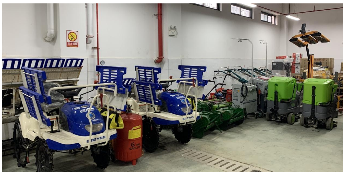
图片 2.5.3 乘坐式插秧机