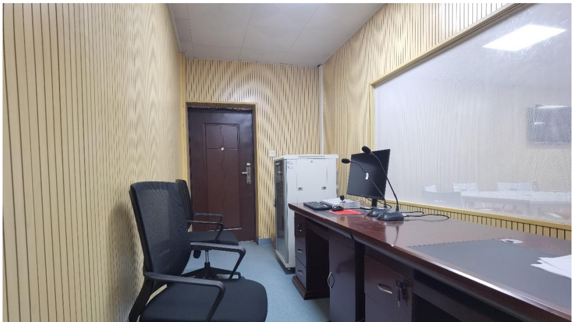
图片 2.3.2 后台监控室及相关设备（部分）