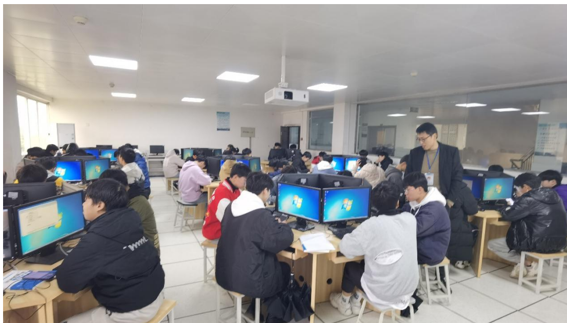
图片 2.4.3 互联网实训课堂