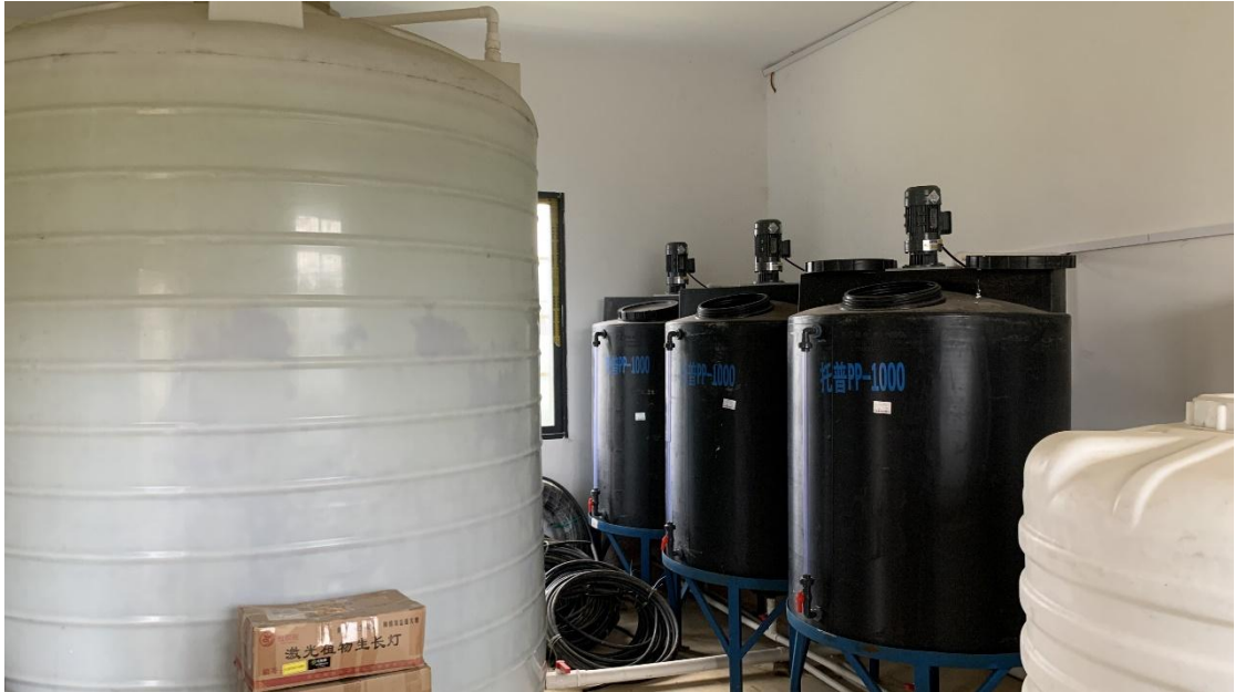
图片 2.1.1 简易中央控制室设备（部分）

(5) 实现果园数据的快速收集、长久保存，为果园灌溉施肥科学定量、土壤情况分析提供数据支撑及技术参考。