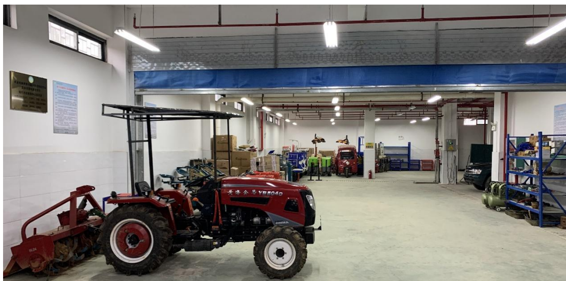
图片 2.5.1 现代农机设备总览