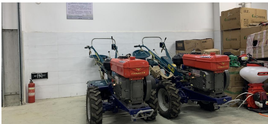
图片 2.5.2 手扶拖拉机（部分）