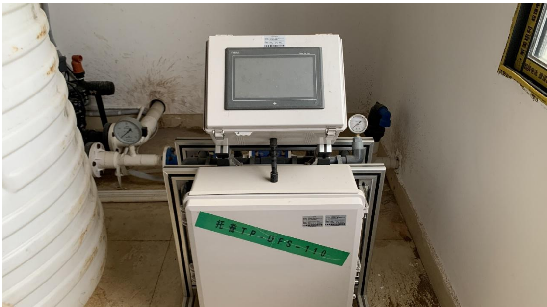
图片 2.1.2 施肥机