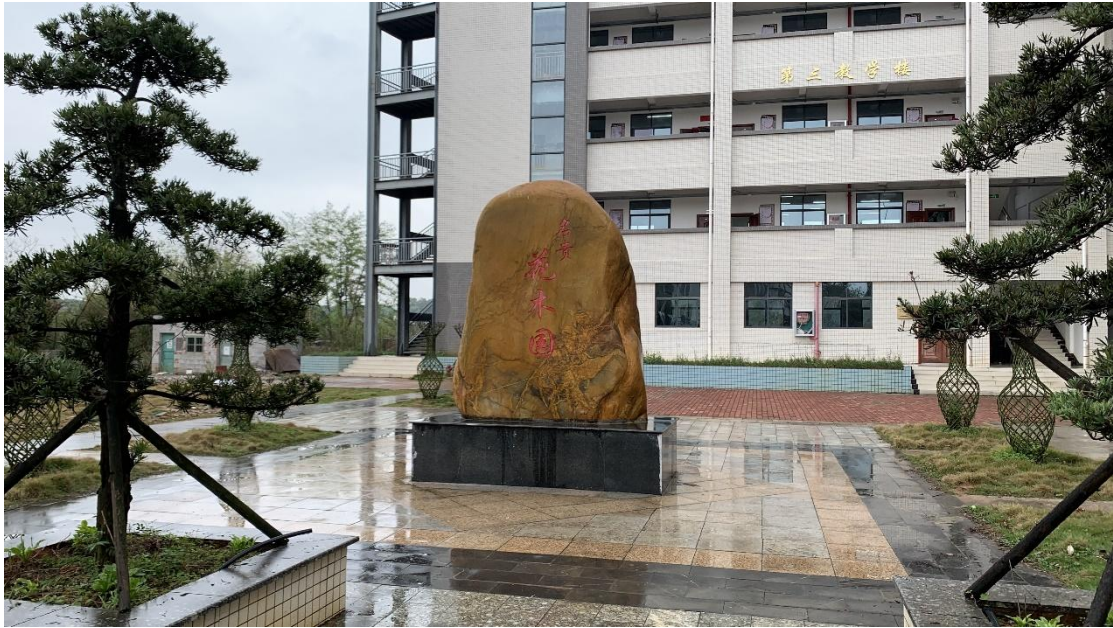
图片 2.2.1 名贵树木花卉实训园

（4）承担地方政府及企事业单位实施在职培训、转岗培训和社会其他人员的培训，以及待岗人员的再就业培训，及为广西实施乡村振兴战略提供人才培训和技术服务。