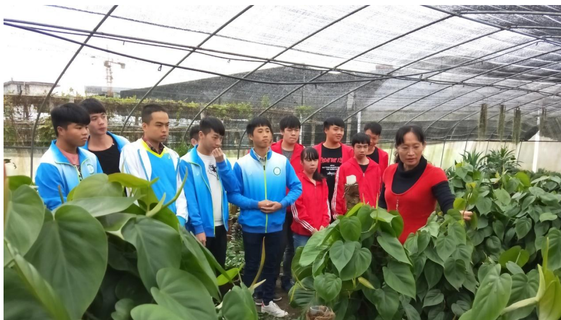
图片 2.2.3 阴生花卉种类识别课堂