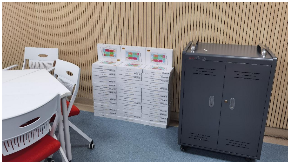
图片 2.3.3 学生学习平板