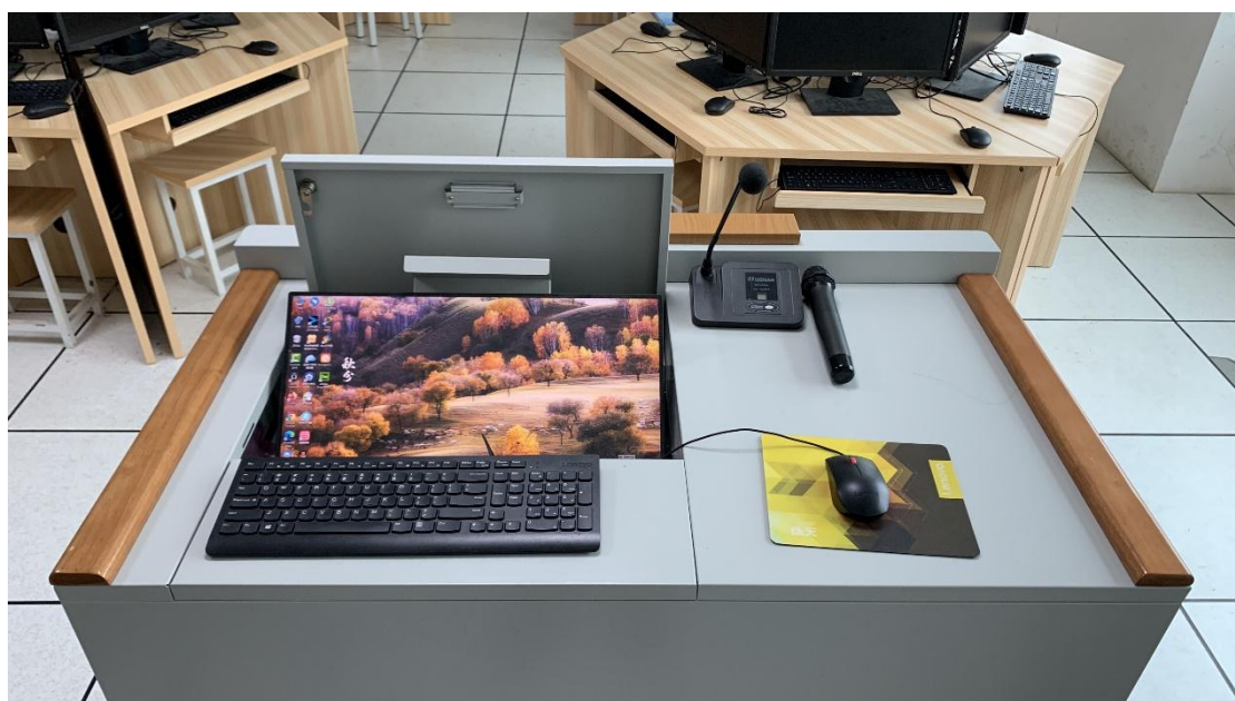
图片 2.4.2 教师多媒体讲台