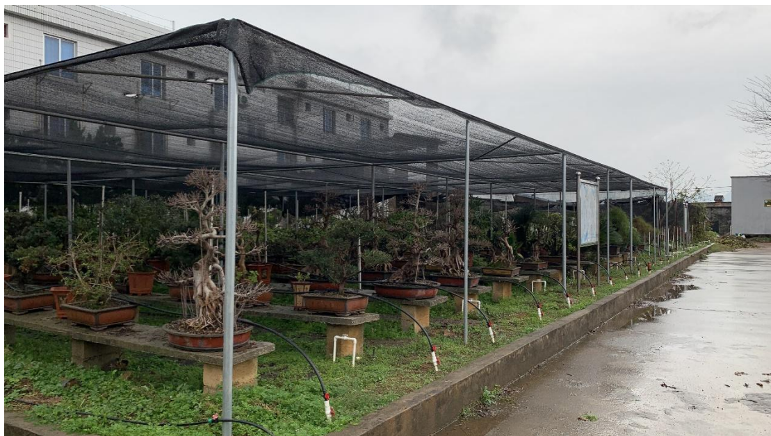
图片 2.1.3 水肥一体化滴灌设备（部分）