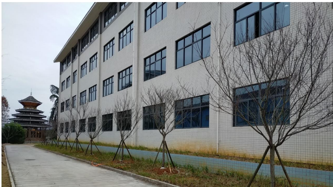
图片 2.2.2 校园内名贵树木（部分）